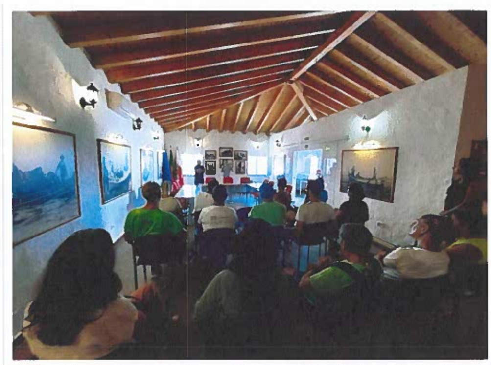
Cerimónia de inauguração dos Percursos Pedestres