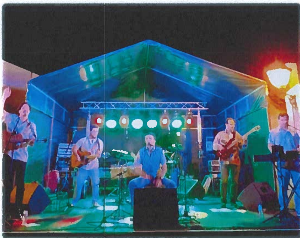
Concerto Baila Maria