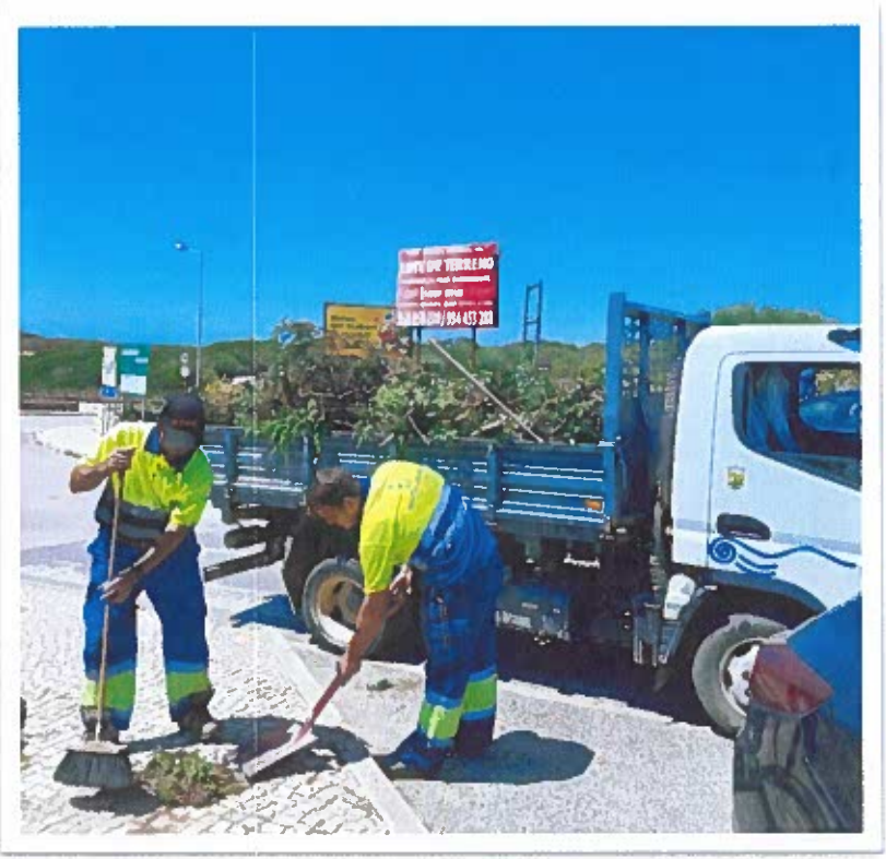
Varredura e limpeza de passeios e bermas