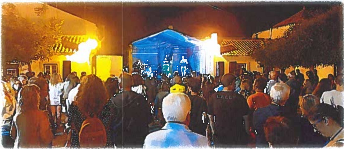
Concerto Raiz Lusa