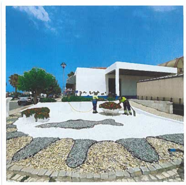
Requalificação do jardim - Mercado Municipal