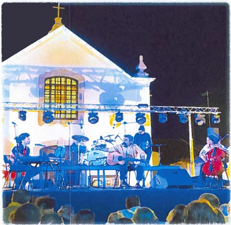
Concerto São Tropez