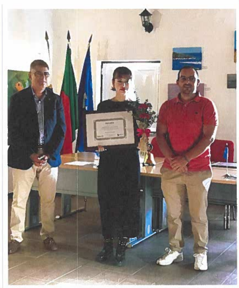
Entrega das bolsas de estudo Luís Gaivoto - Rotary Club de Sines