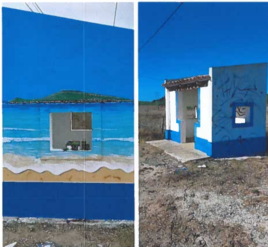
Pintura das paragens de autocarro