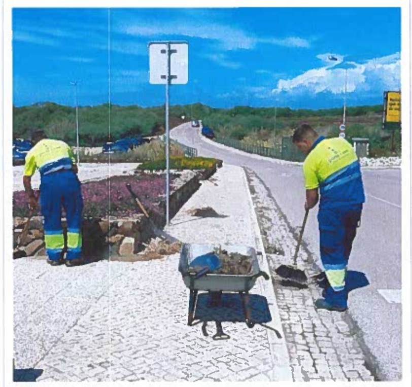
Remoção de arbustos e limpeza de passeios