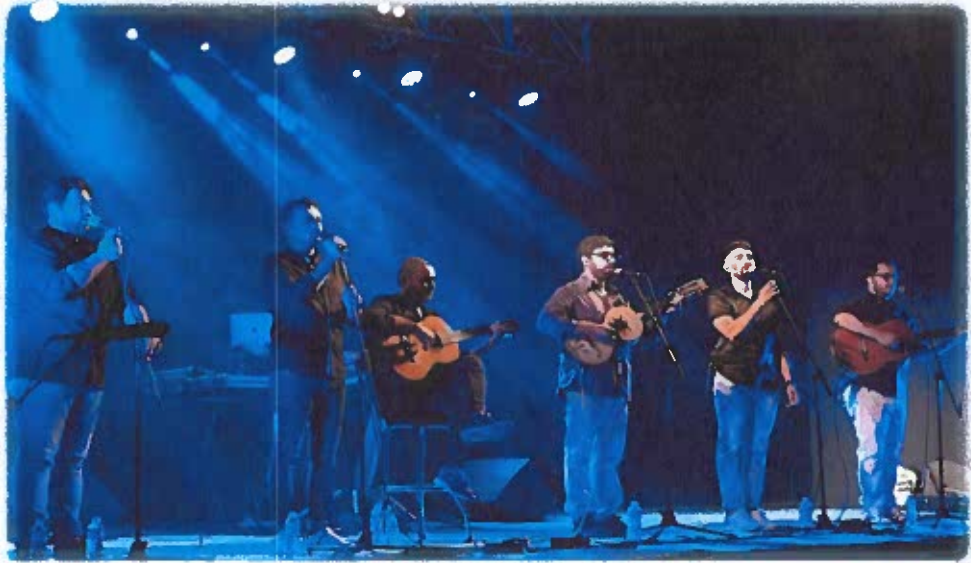
Grupo Al Canti