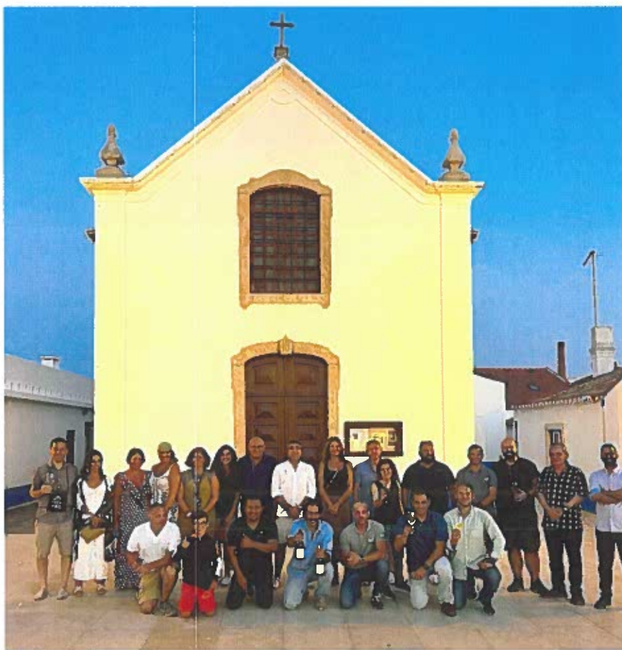
1.ª Edição do Festival do Vinho de Porto Covo