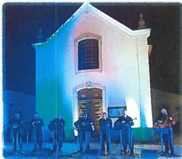
Sinfonias ao Luar