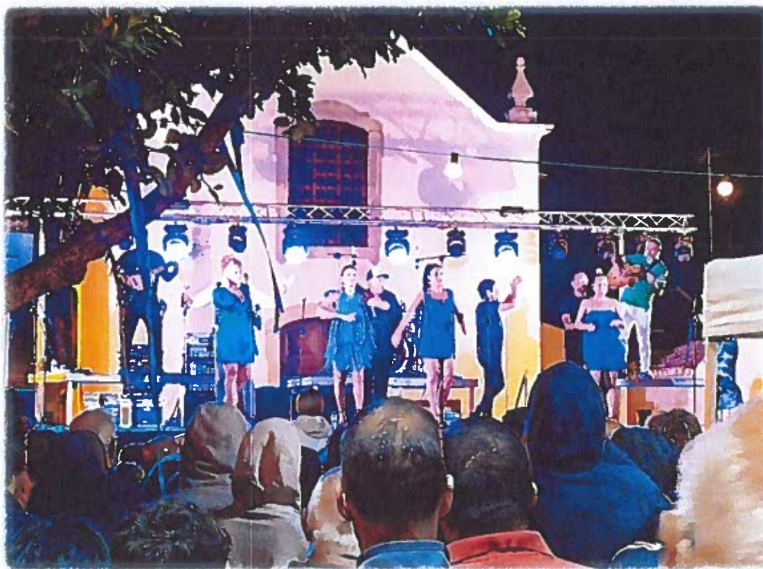
Espectáculo com o Grupo RAYA