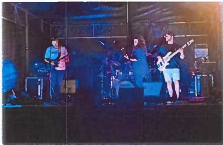
Concerto Linhas Cruzadas