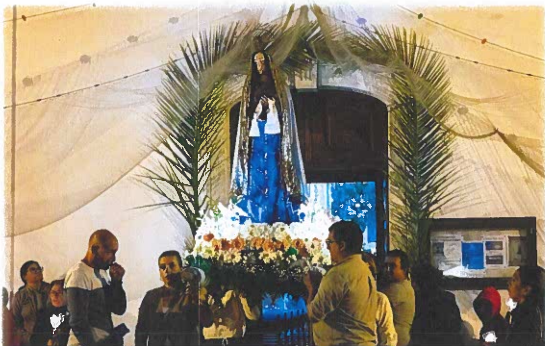
Procissão das velas