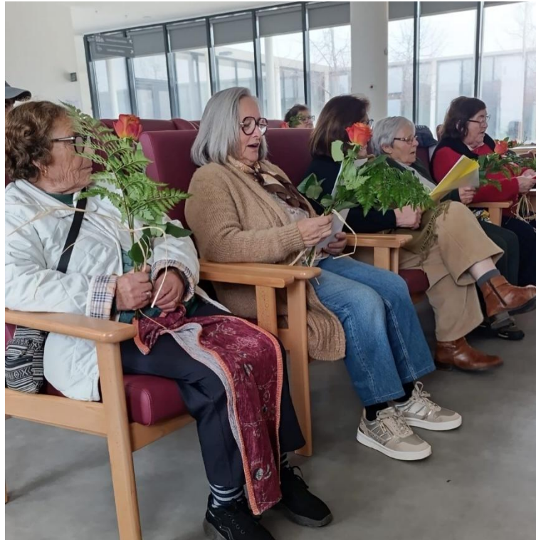
Oferta de Flores no Dia Internacional da Mulher