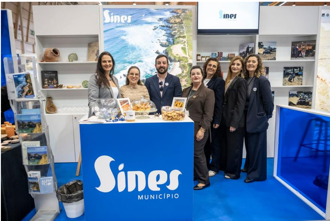
BTL - Better Tourism Lisbon Travel Market