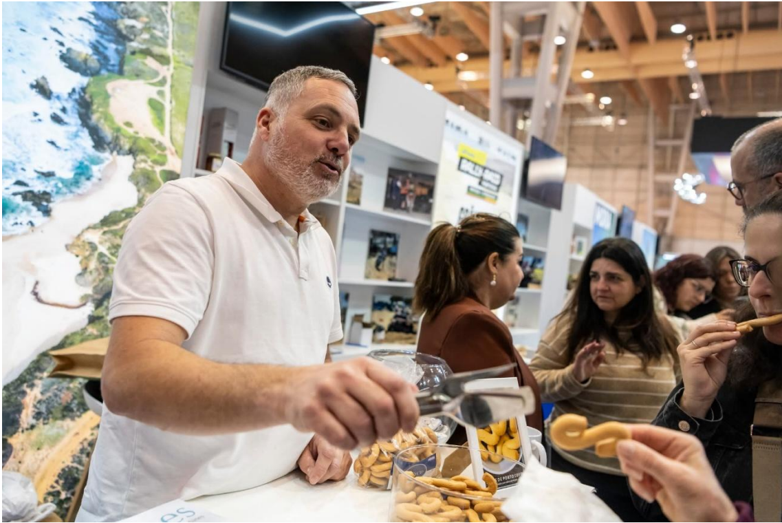
BTL - Better Tourism Lisbon Travel Market