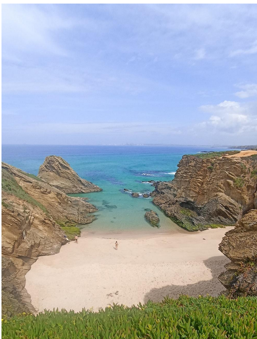
Praia do Banho