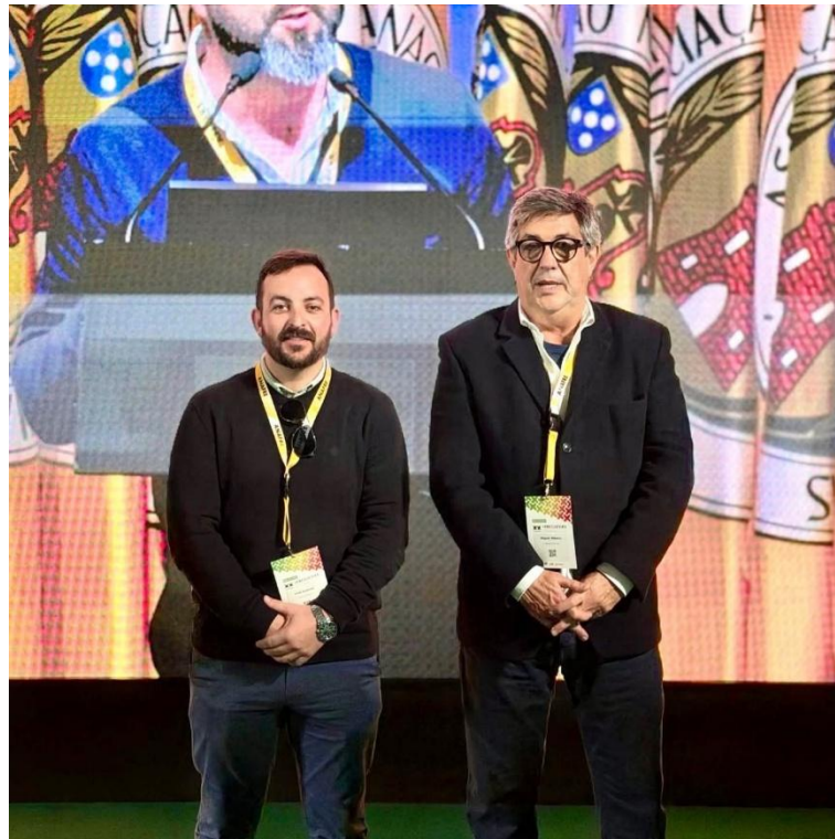
XX Congresso Nacional da ANAFRE - 2026