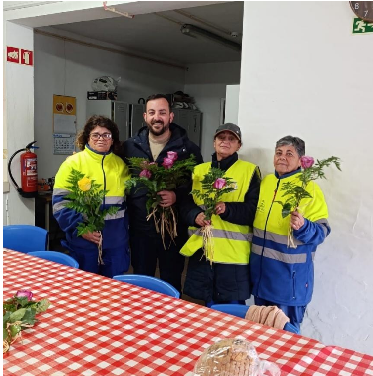
Oferta de Flores no Dia Internacional da Mulher