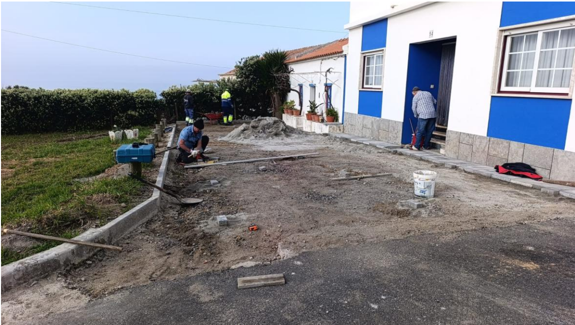
Colocação de Pavê em frente a moradia na Rua 1.º de Maio