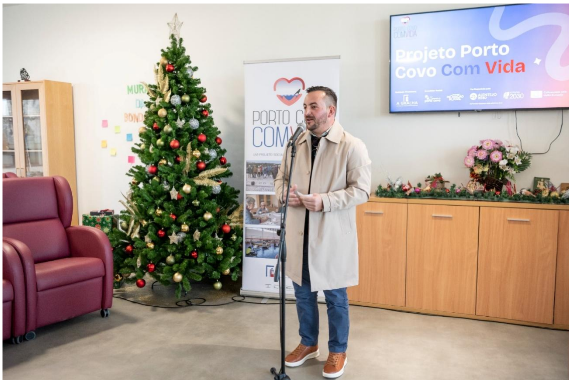
Apresentação do Protejo Porto Covo ComVida enquanto entidade financiadora